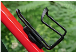
FindMe + Bottle Cage [B]